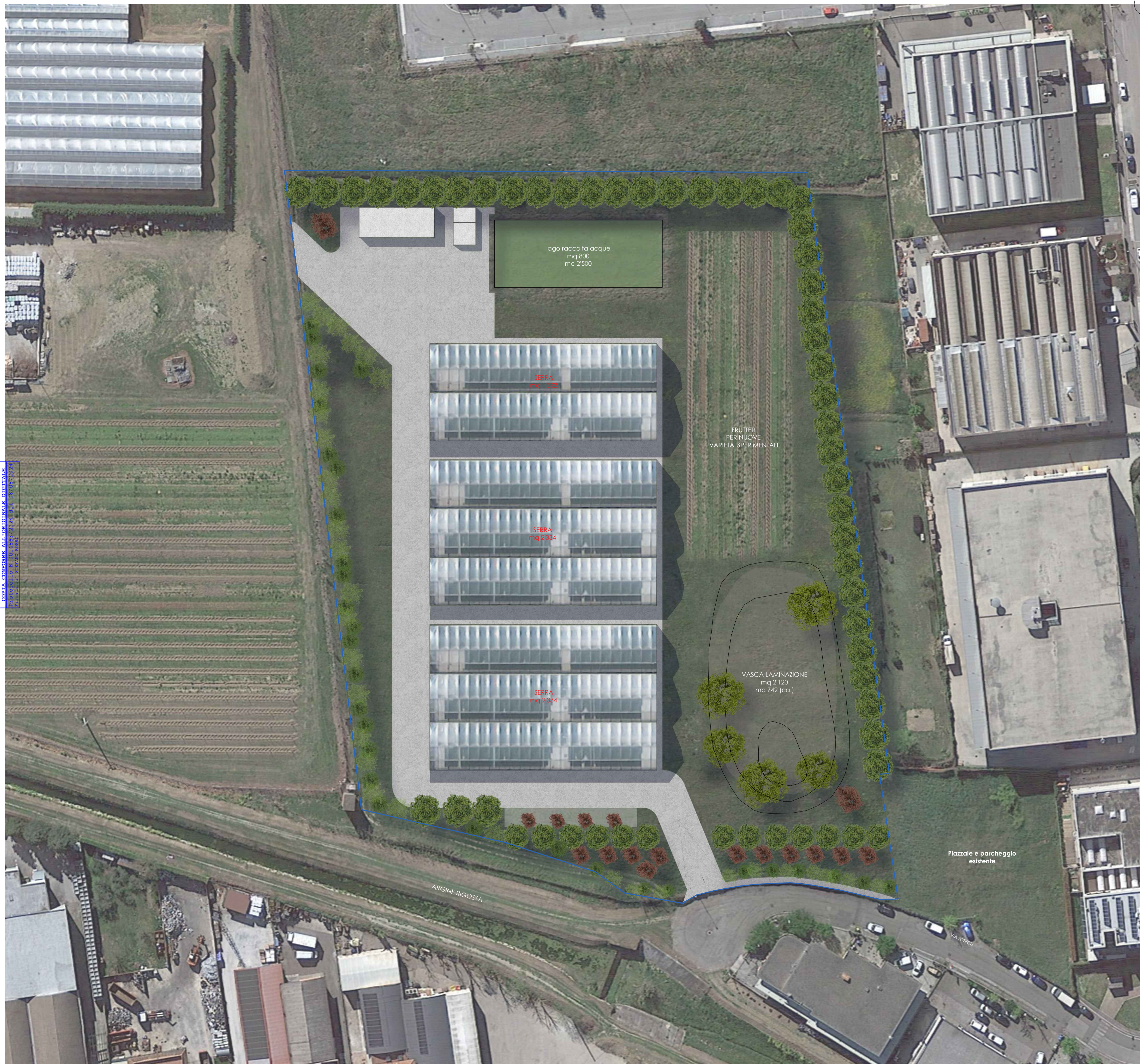
PLANIMETRIA (fotoinserimento) _ Scala 1:500

E COMUNE DI GAMBETTOLA Comune di Gambettola COPERTURA MULTIRISORSA DIGITALE PIANO CATASTRALE PIANO CATASTRALE